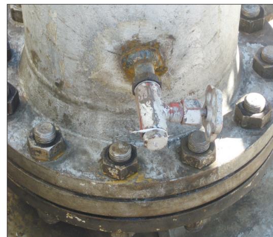
Стакан ПОСЛЕ внедрения «Крана»